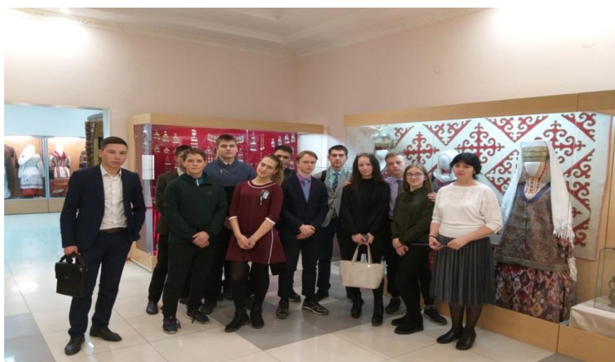
Посещение Костанайского областного историко-краеведческий музей

Костанайский областной историко-краеведческий музей, чьи коллекции составляют почти половину общего музейного фонда области можно по праву его можно назвать визитной карточкой края. В ходе экскурсии ребята изучили зал археологии «Древнейшая история края», зал палеонтологии «Живое прошлое Земли», залы: «Природные богатства Костанайской области», «История родной земли», «Культура и быт народов края», «Основание города Костаная», «Костанайская область: надежды и свершения», «Костанайская область в годы Великой Отечественной войны» (два зала), «Гордость земли костанайской» [2].