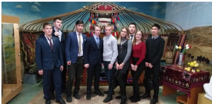
Посещение Рудненского историко-краеведческий музей

Рудненский историко-краеведческий музей, где познакомлюсь с экспозиционными выставками «Алексеевский культурный комплекс», «История ССГОКа и АО «ССГПО», «История АО «Рудныйсоколовстрой», «История и развитие города Рудного» и «Природа родного края» [5].