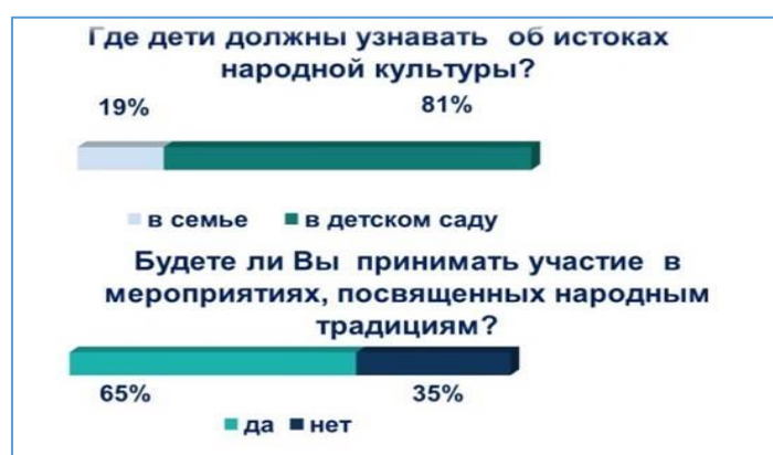
Диаграмма 1 «Результаты анкетирования родителей.

Для решения данных противоречий необходимо тесное сотрудничество с родителями, так как основная роль в воспитании ребенка принадлежит семье.